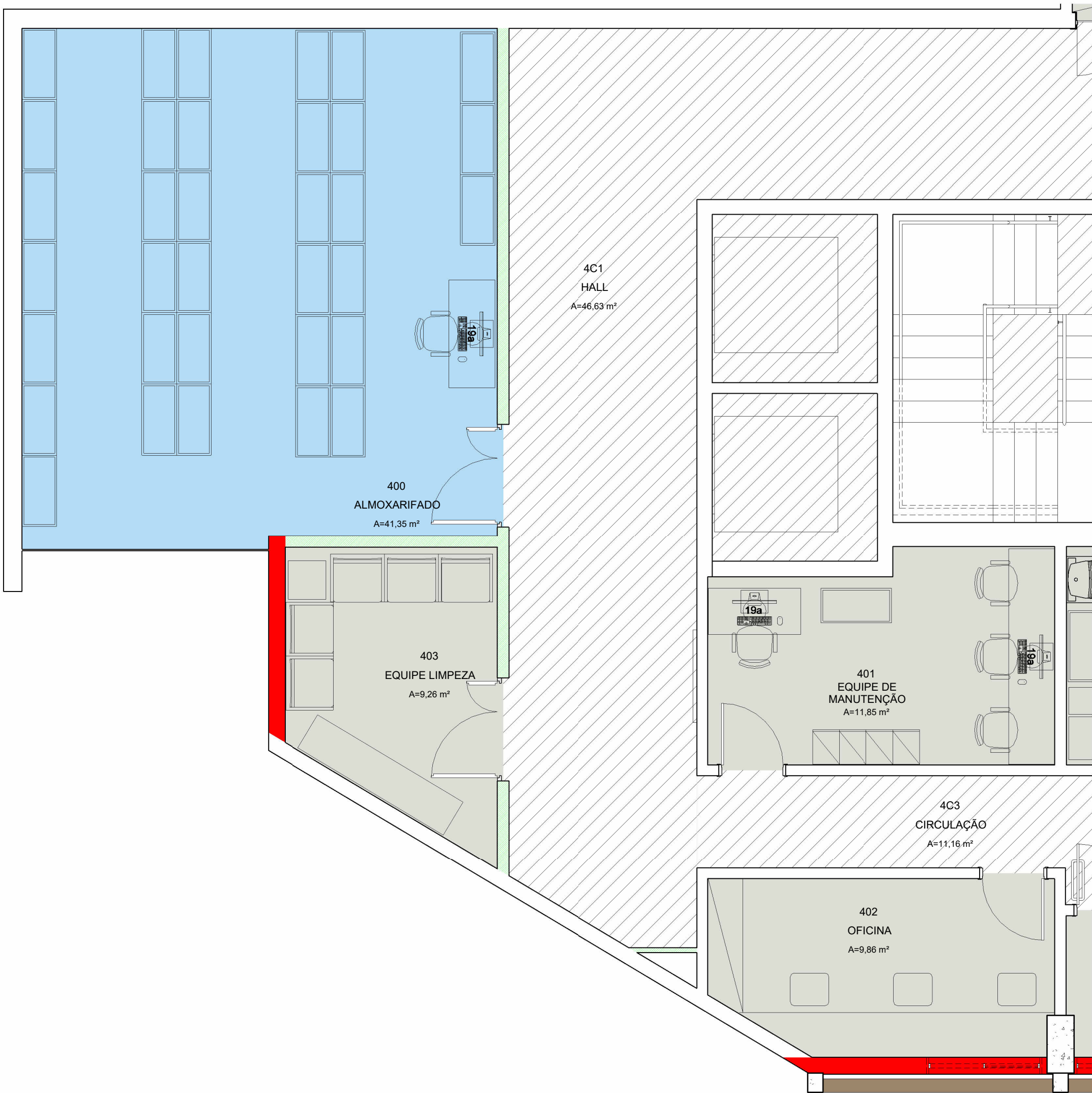
1 ALMOXARIFADO E APOIO 2 ESCALA 1 : 50